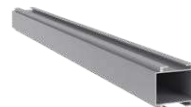
Perfil Tubular 30/20