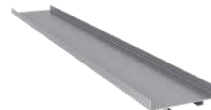
Perfil Baffle 35 ou 50